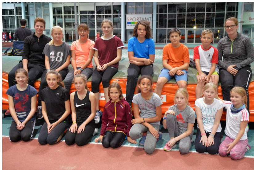
Unsere Leichtathleten (Kids) beim Training in der Leichtathletikhalle in Kalbach.